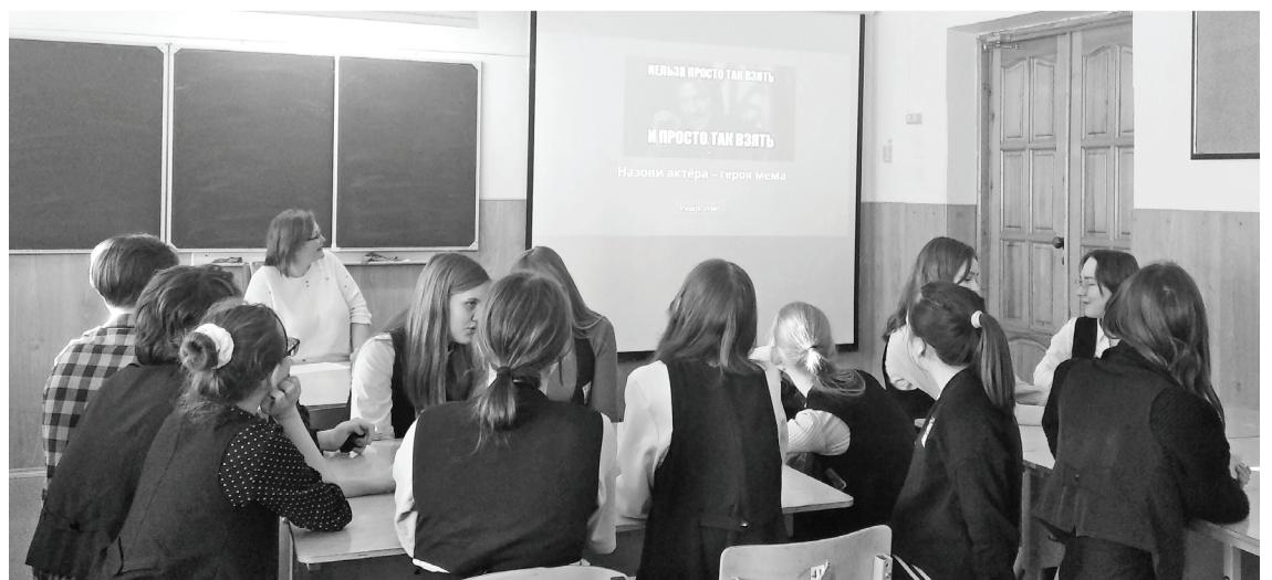
Во время игры «Что? Где? Когда?»